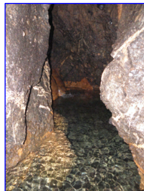
Τυπική διατομή αγωγού με ροή νερού. (~165m. από έξοδο)