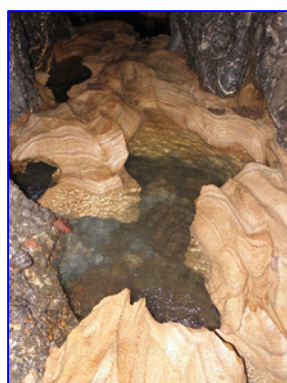
Λιθωματικές Λεκάνες - Λεπτομέρεια (~180m. από έξοδο)