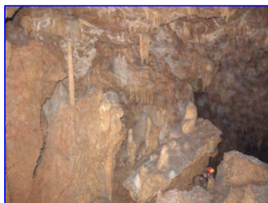
Λιθωματικός Διάκοσμος - Αίθουσα Β (~350m. από έξοδο)