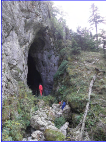
Η μεγαλοπρεπής έξοδος, ύψους 15 m, του υπόγειου ποταμού Σκληθράκι (εξωτερική όψη)