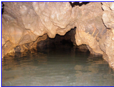
Πλημμυρισμένο τμήμα καρστικού αγωγού (60m. από έξοδο)