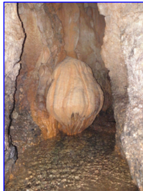
Σταλακτιτικός Σχηματισμός "Μέδουσα". Ροή νερού. (~130m. από έξοδο)