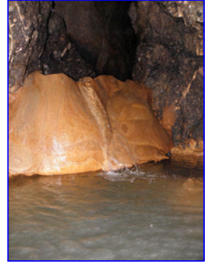
Μικρός Καταρράκτης. (~170m. από έξοδο)