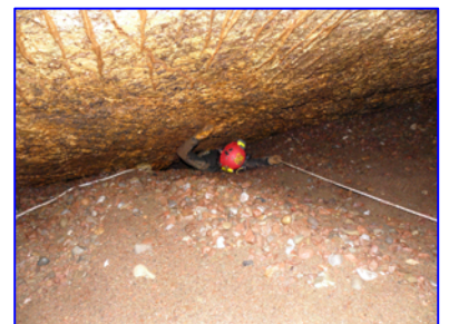
Διάβαση στενίσματος. Έντονη Ροή Λέρα (~420m. από έξοδο)