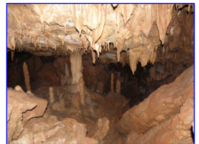
Λιθωματικός Διάκοσμος - Αίθουσα Β (~350m. από έξοδο)