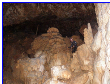
Λιθωματικός Διάκοσμος - Αίθουσα Γ (~400m. από έξοδο)