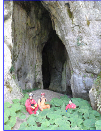
Στην έξοδο του υπόγειου ποταμού. Διακρίνονται ποτάμιες αποθέσεις & βλάστηση