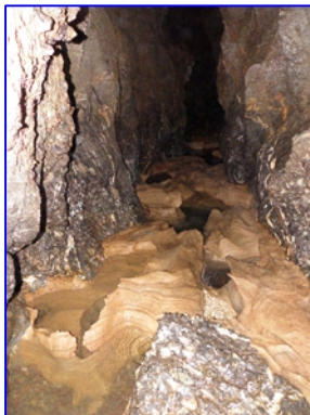
Λιθωματικές Λεκάνες στερεοποιημένης αργίλου. Ροή νερού (~180m. από έξοδο)