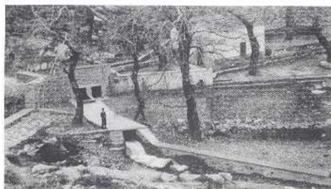
Άγια Τριάδα Έργο Ίδρυματος Καρύστου