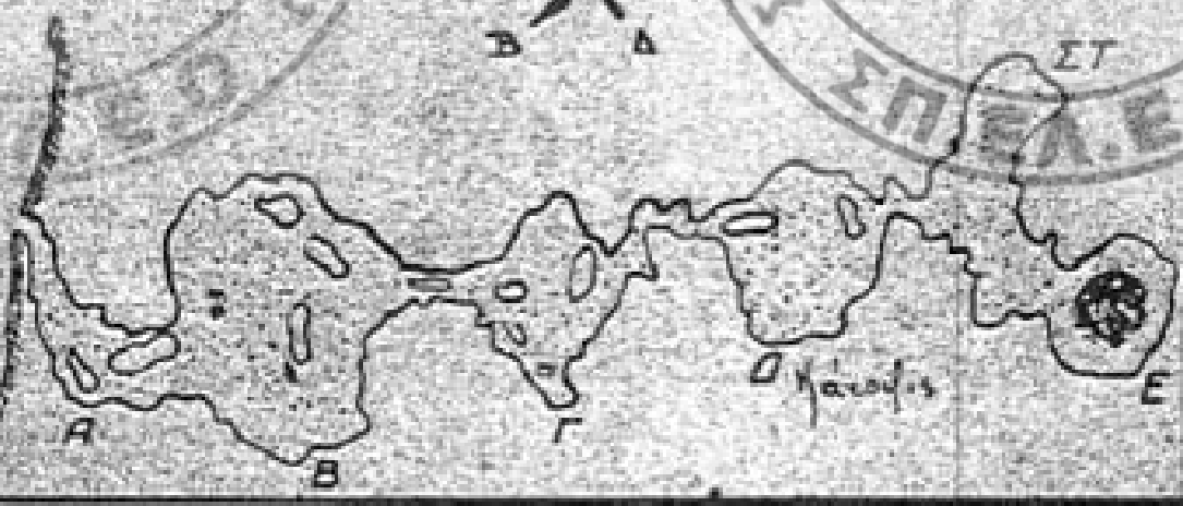
(Σχέδιο κ. Δ. Λουκίσα) Βλ. Το «Βουνό» 1935 σ. 10