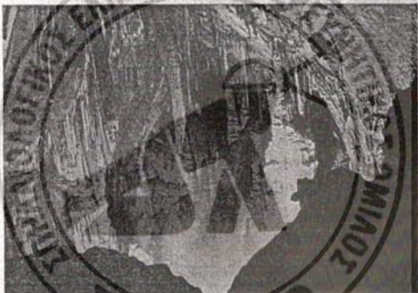
Η σπηλιά του Έρμου — Ο τρίτος θάλαμος

Η σπηλιά για την οποία έχουν κυκλοφορήσει τόσο θόρυβοι, δεν μας φάνηκε